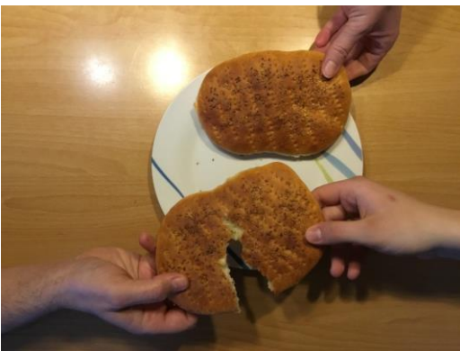
Schülerarbeiten Zab 2

Jesus trägt schwer. Er erträgt viel, bis zuletzt. Und Tod wird zum Leben.